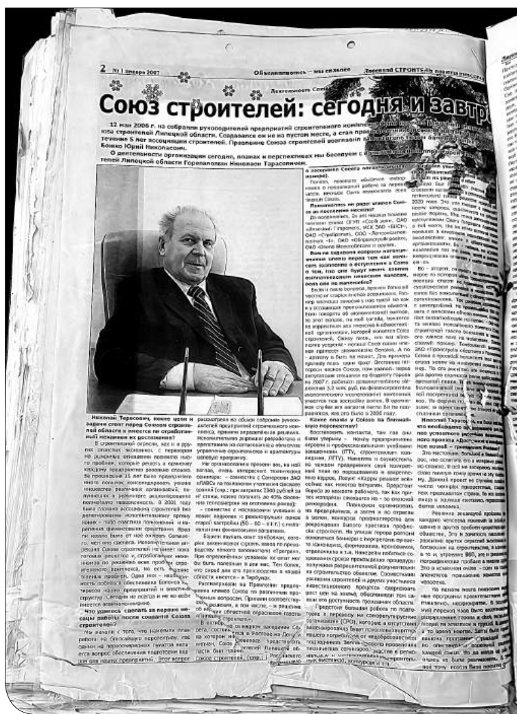
Первое интервью первого директора Союза строителей в первом номере родной газеты