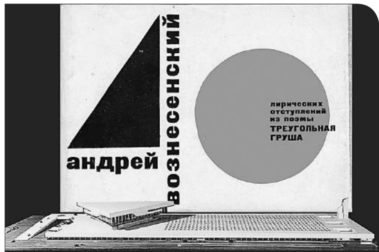
Макет автотехцентра «Жигули» на фоне «Треугольной груши»

А дело было так — вначале градостроительный совет Санкт-Петербурга раскритиковал проект канадского архитектора Джека Даймонда, который, по мнению совета, не соответствовал принципам исторической застройки Петербурга. Минкультуры в свою очередь заявило об отказе от строительства золотого купола театра, предусмотренного проектом Доминика Перро. По словам чиновников, в проекте купола, ранее утверждённом Госэкспертизой, нашли 400 ошибок. Проект Новой сцены Мариинского театра, для которого архитектор Эрик Мосс предложил стеклянные конструкции, окрестили «мусорными пакетами»