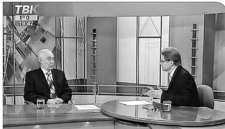
2009 год. Стоп-кадр из телепрограммы «Точка зрения»

Конечно. Именно в это время активно застраивалась ОЭЗ «Липецк», и туда допускали только самых надёжных и ответственных подрядчиков. Тогда же, кстати, начали возводить