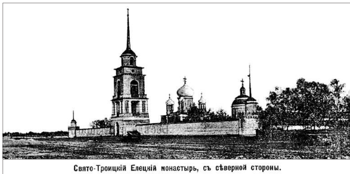
Свято-Троицкий Елецкий монастырь, съ северной стороны.

дельцев огородов: «Нам картошку и помидоры сажать, а вы тут со своей наукой и лопатами!».