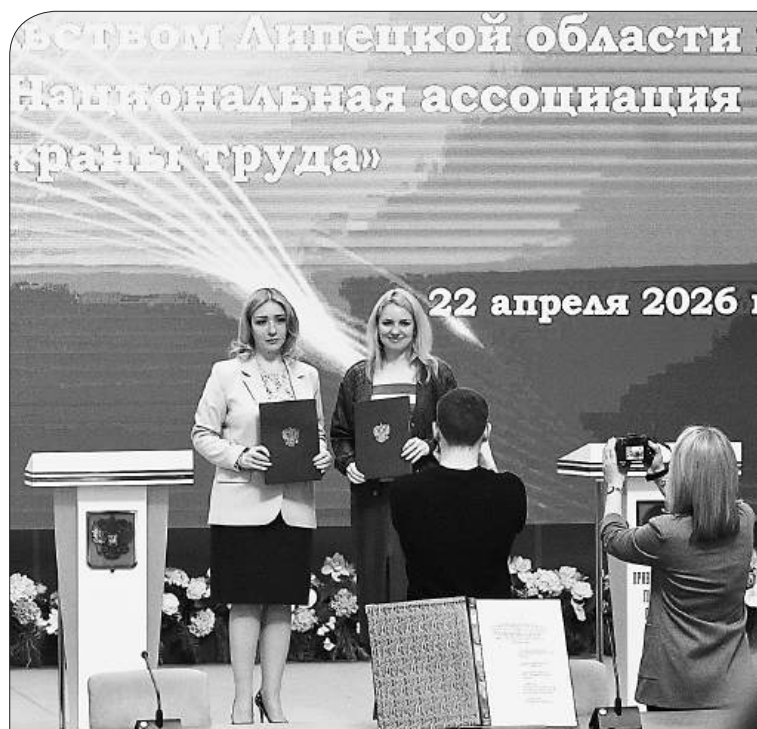
Соглашение о взаимодействии между правительством Липецкой области и Национальной ассоциацией охраны труда подписано

Межрегиональный форум, посвящённый Всемирному дню охраны труда, прошёл 22 апреля 2026 года в здании Правительства Липецкой области. Тема форума «Безопасная и комфортная среда на производстве: ресурс для сохранения кадров и роста экономики». В Липецкой области эти задачи поставлены в приоритет. Соответственно, где, как не здесь, обсуждать возможности их эффективной реализации, от законодательных новаций до практических кейсов.