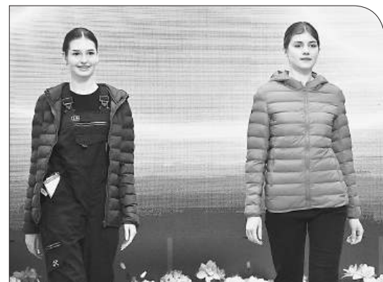
Спецодежда должна не только защищать, но и радовать

Таможенного союза 019/2011 «О безопасности СИЗ» — что изменится для поставщиков и работодателей» и «Эффективная система управления охраной труда как инструмент сохранения кадрового потенциала».