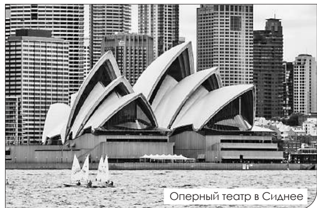
Оперный театр в Сиднее